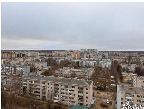
Вид с улицы Воркутинской